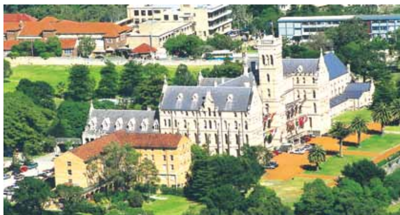
View of ICMS Campus, Sydney, Australia

悉尼国际管理学院 (ICMS) 规划了未来一年宏伟的发展计划，这是一个激动人心的时刻。作为公认的管理和应用职业培训教育方面的领导者，该学院旨在扩大其课程设置，同时提高其国际关系。